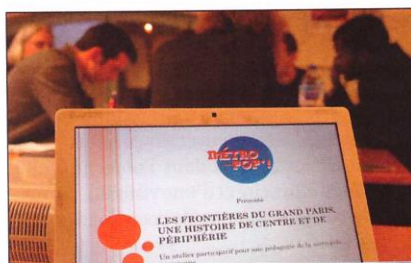
Les Ateliers participatifs encouragent une dynamique de la société civile sur les enjeux métropolitains.

Depuis 2012, notre association Métropop'! , dont l'objet est de concourir au changement de perception des quartiers populaires, s'est emparée du projet de métropole grand parisienne et s'efforce d'en faire un objet politique, c'est à dire citoyen, d'émergence de parole et de participation.