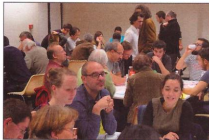
Les Métrokawa, des rendez-vous de coproduction et de convivialité autour des questions métropolitaines.